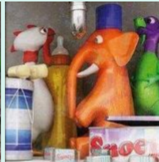
AOS OLHOS DE UMA CRIANÇA