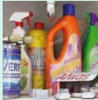
AOS OLHOS DE UM ADULTO

NÃO DEVEMOS ARMAZENAR QUAISQUER PRODUTOS DE LIMPEZA FORA DE SUAS EMBALAGENS ORIGINAIS SEM ROTULAR E MUITO MENOS DEIXÁ-LOS AO ALCANCE DE CRIANÇAS E PETS!